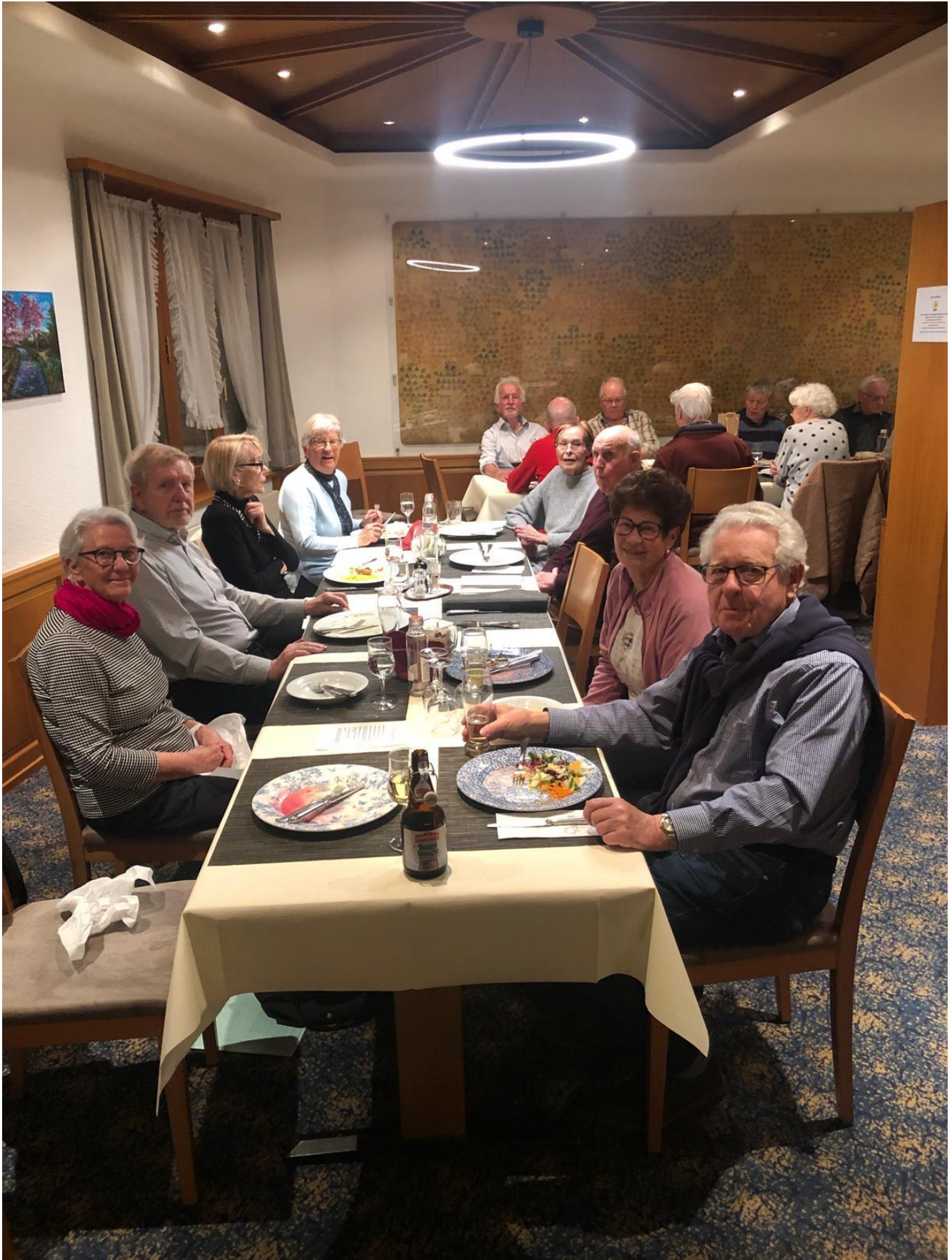
Auch ein kleiner Verein weiss den Augenblick zu geniessen.